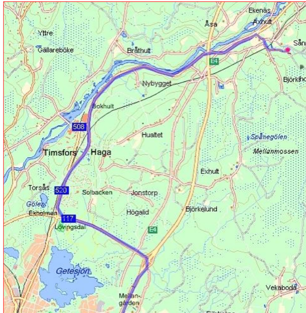
Afkørsel 75 til Kulsvierhytten