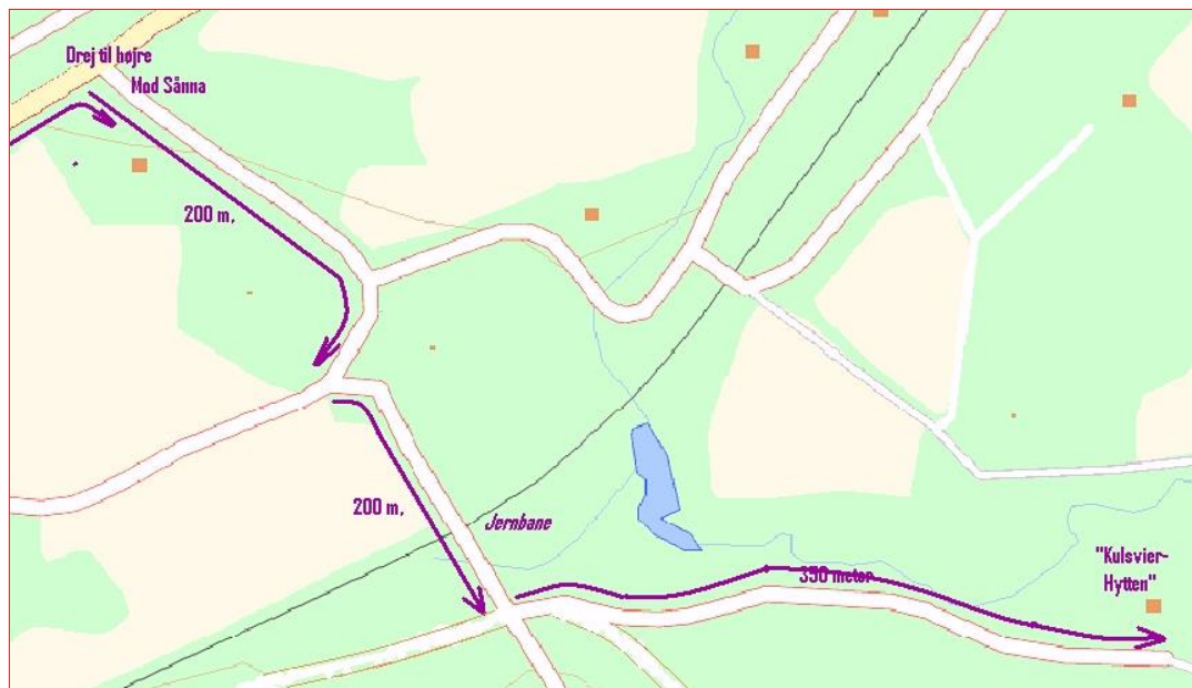
Efter motorvejsbroen til Kulsvierhytten